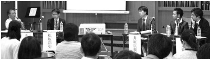
パネル・ディスカッションの様子

そのうえで、文化芸術の創造と発信に向け、「多様な文化の受容者にどのように発信していくのか」「日本の文化をエキゾチックなものとして捉えるのか、