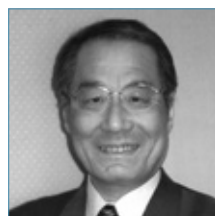
日本音楽芸術マネジメント学会 理事